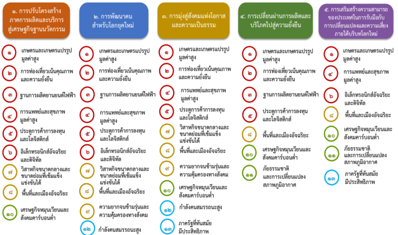
แผนภาพที่ ๓.๑ ความเชื่อมโยงระหว่างหมวดหมู่การพัฒนา กับเป้าหมายหลัก

ความเชื่อมโยงระหว่างหมวดหมู่การพัฒนา กับเป้าหมายหลักแสดงไว้ในแผนภาพที่ ๓.๑ โดยหมวดหมู่ การพัฒนาที่กำหนดขึ้นเป็นประเด็นที่มีลักษณะเชิงบูรณาการที่ครอบคลุมการพัฒนาตั้งแต่ในระดับต้นน้ำ จนถึงปลายน้ำ และสามารถนำไปสู่ผลพัฒนาทั้งในมิติเศรษฐกิจ สังคม ทรัพยากรธรรมชาติและสิ่งแวดล้อมไป พร้อมๆ กัน ทำให้หมวดหมู่แต่ละประการสามารถสนับสนุนเป้าหมายหลักได้มากกว่าหนึ่งข้อ นอกจากนี้ การพัฒนาภายใต้แต่ละหมวดหมู่ไม่ได้แยกขาดจากกัน แต่มีการสนับสนุนหรือเอื้อประโยชน์ซึ่งกันและกัน