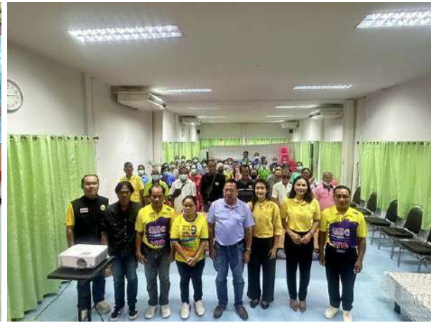
42.โครงการส่งเสริมการพัฒนาทักษะการเรียนรู้การฝึกอาชีพพระยะสั้นสำหรับผู้อายุ