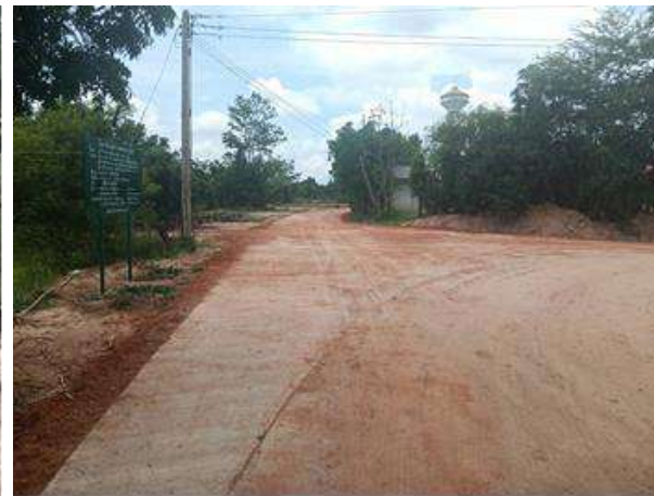
16.โครงการก่อสร้างถนนดินพร้อมลงลูกรังจากนายนบุญเหลือถึงคลองโปง หมู่ที่ 2 (ข้อบัญญัติ)