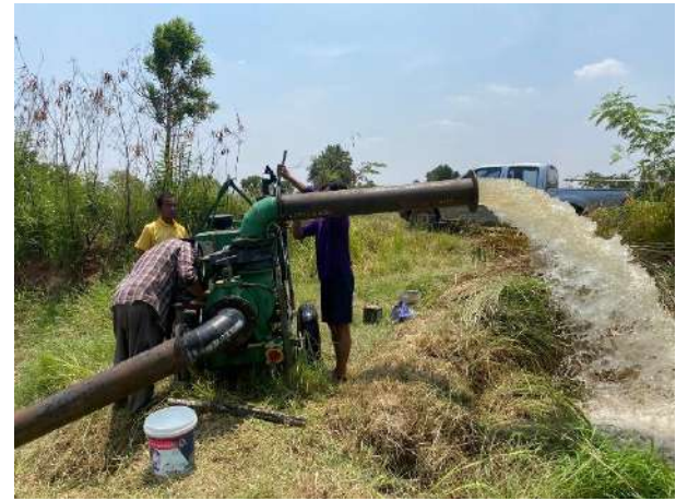
60.โครงการกำจัดวัชพืชคลองลำน้ำเค็ม บ้านขามเวียน หมู่ที่ 3