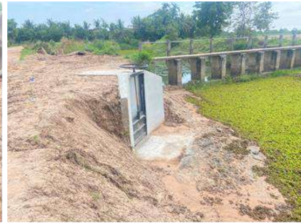
18.โครงการก่อสร้างถนน คสล. รหัสทางหลวงท้องถิ่น นม. ถ.131-16 สายหนองล้งถึงดอนลำดวน หมู่ที่ 6 (ข้อบัญญัติ)